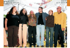
Mitternachteinlage 2009 Guglhupf Ensemble